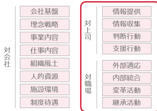
▲モチベーションクラウドを構成する 16 領域

今回の事業譲受の目的は、現在当社の重点戦略事業である「モチベーションクラウド」とのシナジー創出のためです。「モチベーションクラウド」は、企業の従業員エンゲージメント向上を目的とした、組織診断・改善のクラウドサービスで、対会社・対上司・対職場の 16 領域・64 項目で構成されています。今回、事業譲受する社内コミュニケーションツール「Oneteam」は、その中でも、対上司・対職場に関する8領域・32項目を改善するサービスへと進化させることが可能です。既存の「Oneteam」の機能を活かしつつ、当社の「モチベーションクラウド」とのシナジーを創出する機能を搭載していくことで、より多くの組織変革へと貢献してまいります。