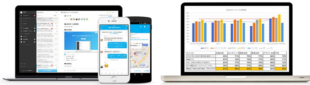
▲社内コミュニケーションツール「Oneteam」

株式会社 Oneteam は、「生産性の高い組織」づくりを実現するための社内コミュニケーションツール「Oneteam」を展開しています。「Oneteam」は、組織におけるコミュニケーションの課題発見・原因分析・解決策の実施・振り返りまでをサポートしており、情報の透明性を上げ、組織の生産性を高めるためのコミュニケーションツールとして、800社を超える企業・団体に利用されています。