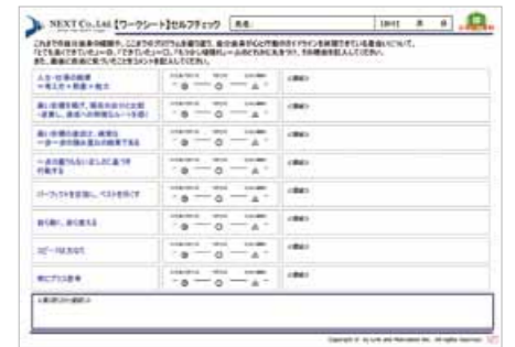
「心と行動のガイドライン」セルフチェックシート

「クリエイトモチベーションに求人広告を提案せよ!」というタイトルのビジネスシミュレーションは、「自然公園を作れ」や「怪獣型ロボットペロゴンを製作せよ!」などを通して1日目に学んだ「心と行動のガイドライン」を、ビジネスの場面で活用することの重要性・難しさを体感する場です。ここでも、例えば、参画感の薄いメンバーには「『自ら動く、自