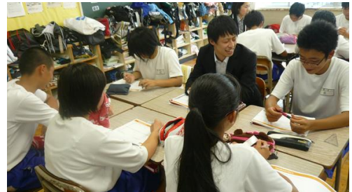
昨年の授業の様子